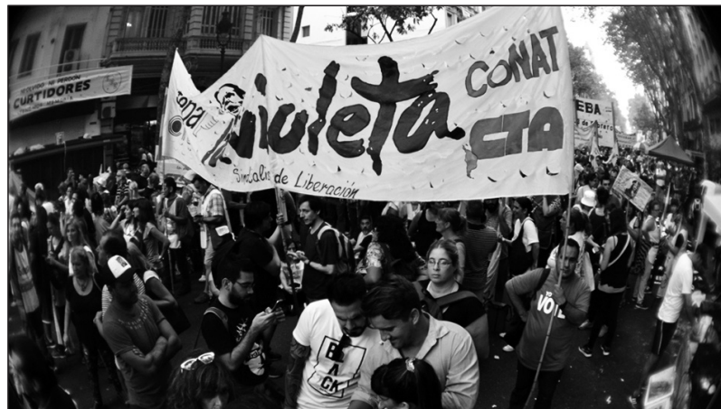
Que se cumpla con la ley de financiamiento educativo

“Queremos que este debate llegue hasta el final”, aseveró para dejar en claro a qué se refiere cuando -cada vez con más insistencia- plantea que el gobierno que encabeza vino a provocar un “cambio cultural” en un contexto en el que en dieciocho provincias hay conflictos abiertos como consecuencia de las ofertas salariales hechas a los trabajadores de la educación. Y fue contundente cuando instó a su staff a “no detenernos frente a aquellos que quieren que este cambio no avance”. Mientras, en el territorio bonaerense, se lleva-