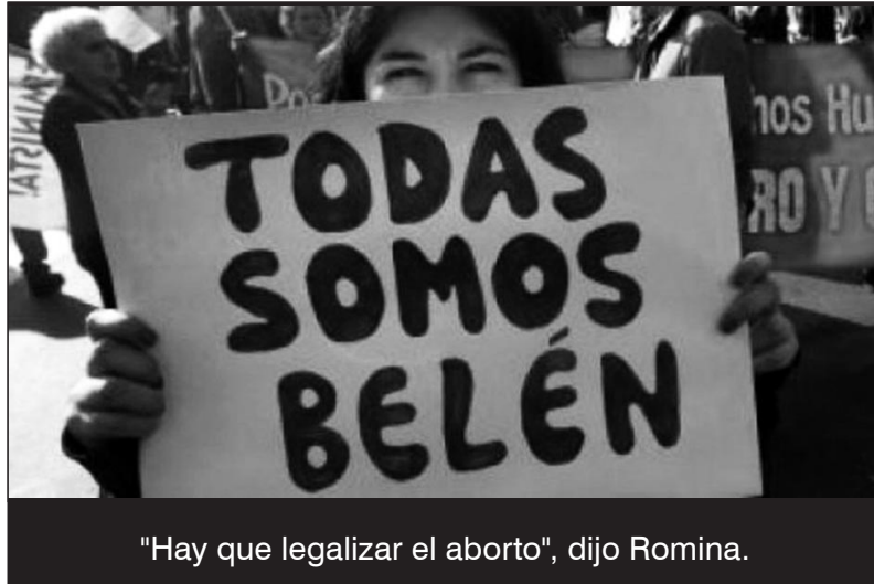
"Hay que legalizar el aborto", dijo Romina.

Tras lo que resaltó: “ningún otro integrante de la población está más cerca de ser detenido