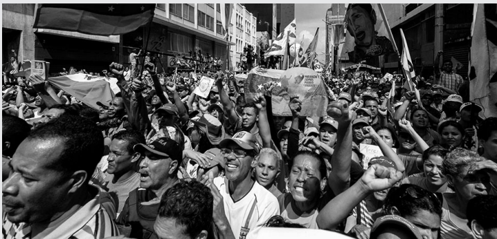
Miles: de venezolanos volvieron a ganar las calles de Caracas para manifestar contra la injerencia de la OEA en su país, respondiendo al “llamado para la Patria” que hizo el presidente Maduro y convocó a que el pueblo debata a nivel nacional para definir si su país sigue en la OEA.

Mientras tanto, desde Bolivia, el presidente Evo Morales aseveró que la Revolución Bolivariana triunfó una vez más en la OEA y respaldó a su par, Nicolás Maduro. Y, tras criticar al titular de ese organismo a quien calificó como “agente imperialista de dominación” fue claro cuando señaló: “Venezuela no está sola, estamos aquí para defender la revolución democrática, no solo en Bolivia, sino también en América Latina”.