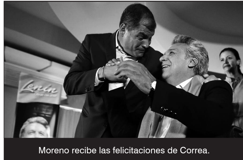
Moreno recibe las felicitaciones de Correa.

Lo ajustado de la victoria de Alianza País, no es extraña en un momento en que en toda Latinoamérica, la derecha vuelve a ganar espacio social y político, pero también trae algo